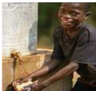
A hand-washing station at a UNICEF supported school in Lobaye Province, Central African Republic.

Aunque la gente alrededor del mundo lavan sus manos con agua, muy pocos lo hacen con jabón en ocasiones cruciales. Mayor lavado de manos con jabón significa menores ratios de enfermedades infecciosas: ¡Manos Limpias Salvan Vidas!